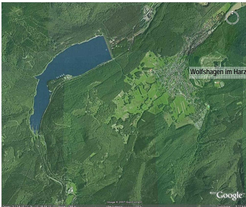
Abb. 1: Region Westharz

Das Planungsgebiet befindet sich im nordwestlichen Teil der Region Westharz und umfasst etwa 1600 Hektar um den Innerstestausee und Wolfshagen (Abb. 1). Die größte Ausdehnung des Gebietes in Längsrichtung beträgt etwa sieben, in Querrichtung etwa drei Kilometer.