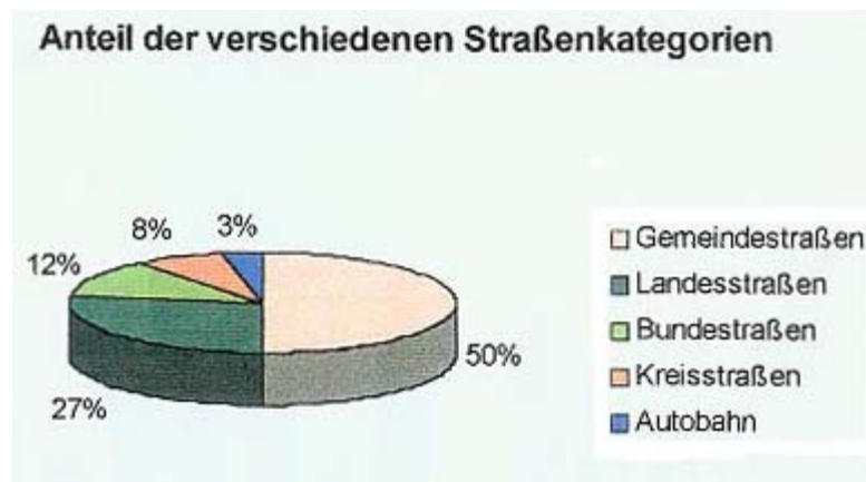
Abb.1: Anteil der verschiedenen Straßenkategorien

Als Untersuchungsgebiet dient das Land Brandenburg, welches trotz seiner geringen Einwohnerzahl im Vergleich zu anderen Bundesländern ein dichtes Straßennetz mit einer großen Anzahl von Alleeen aufweist. Gegenstand der Untersuchungen sind die Alleeen der Kreis- und Gemeindestraßen, deren Anteil 58% des gesamten Straßennetzes ausmachen (Abb. 1).